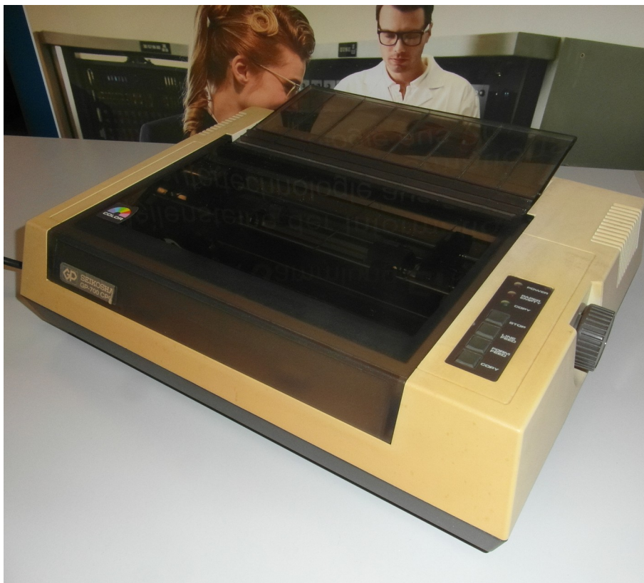
Der GP-700A war mit einer

Hier verteuerte sich der Preis um etwa 200.- DM.