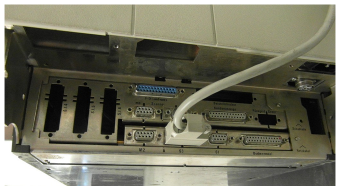
Anschlüsse der Zentraleinheit